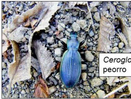
Ceroglossus chilensis peorro