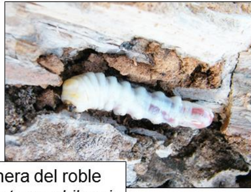
Gusanera del roble Holopeterus chilensis