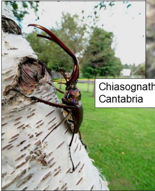
Chiasognathus grantii Cantabria