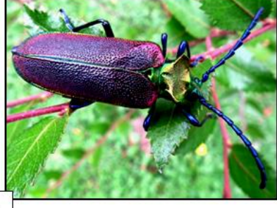
Coleóptero de la luma Cheloderus childreni