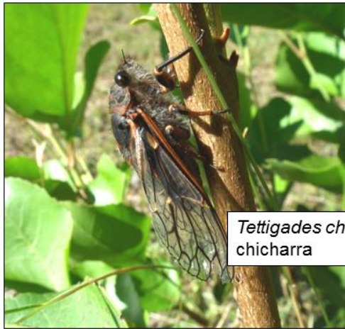
Tettigades chilensis chicharra