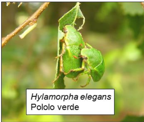
Hylamorpha elegans Pololo verde