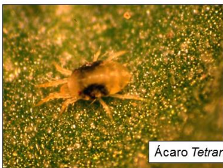
Ácaro Tetranychus urticae